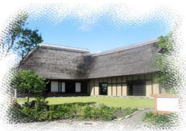
盛冈手工艺村的南部曲屋

盛冈手工艺村位于盛冈市46号国道以西，开车大约30分钟。它坐落在能感受四季变化之美的御所湖风景区之中，是一所代表盛冈手工艺产业的观光设施。设施内有十一个手工行业共15个手工作坊。在这里，您不但可以近距离参观工匠的传统技艺，而且在倍受欢迎的手工制作体验室里还能欣赏10种以上具有特色的手工艺品，并且可以体验乡土名菜的制作。盛冈手工艺村内还设有江户时代的人马同居的南部曲屋民居。我们可以了解当时的生活并感受当地的文化历史。下面，我们从丰富多彩的手工制作体验室向大家介绍具有代表岩手特色的手工艺体验。